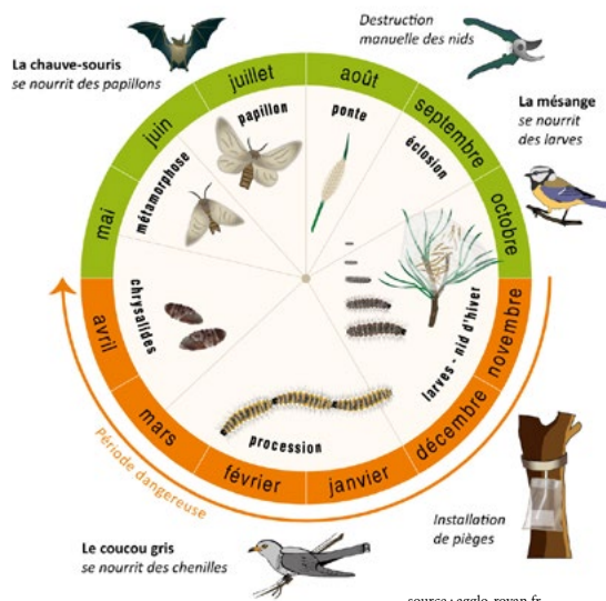
Cycle annuel de la processionnaire du pin nos alliés dans la lutte

Après éclosion, les larves passent par cinq stades dans un nid de soie placé au sommet d'une branche. Elles n'en sortent que la nuit pour s'alimenter d'aiguilles de pin. Elles se déplacent dès le printemps en procession vers le sol afin d'y effectuer leur nymphose dans un cocon enterré sous la terre . Elles ressortent de terre quelques mois après sous la forme de papillons nocturnes.